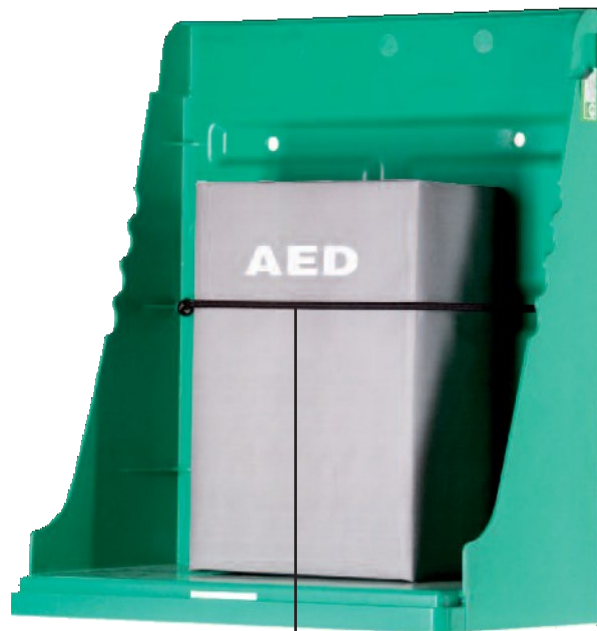
Лента за прикрепяне на АВД

В = 400 мм, Д = 341 мм, Ш = 198 мм, Тегло = 1,5 кг