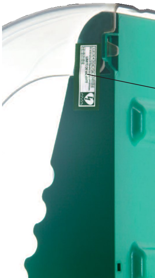
Етикети за запечатване